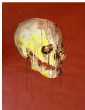
Vanity case / Acrylique sur papier 65 cm x 50 cm / 2009

Vernissage le jeudi 4 novembre à partir de 18 h