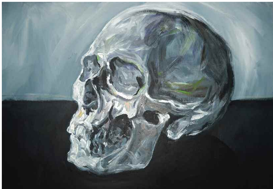
Fred Calmets / Vanitas / Acrylique sur toile / 130 cm x 97 cm / 2010