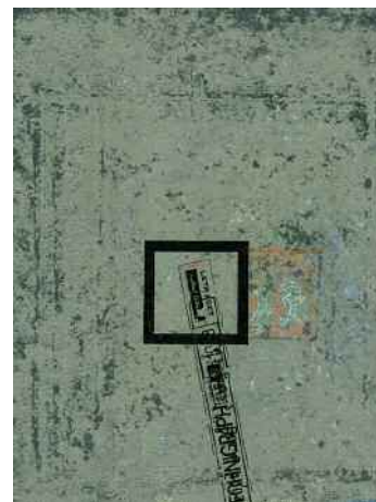
Michelle Knoblauch - Buvards - Technique mixte - Format 21 x 16 cm

En janvier, deux expositions sont organisées en parallèle pour présenter les œuvres de Michelle Knoblauch et de Thomas, une à Tokyo à la Galerie Gem Art du 7 au 22 janvier 2012 et l'autre du 17 janvier au 5 février 2012, à 10 000 km de là, au cabinet d'amateur à Paris, où ils seront de retour pour vous accueillir lors du vernissage, le 19 janvier.